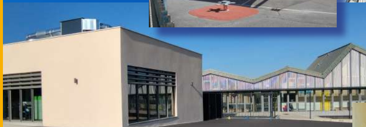
Extension du restaurant scolaire