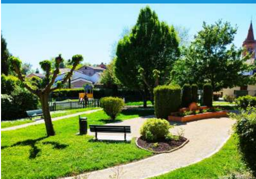
Remise en état du jardin'loup