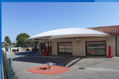
Création d'un préau école maternelle

Montant total PART COMMUNALE « non exhaustif » 1 259 597 €