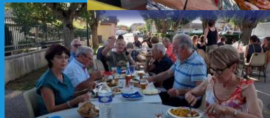
Repas annuel des anciens