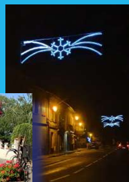
Éclairage de Noël