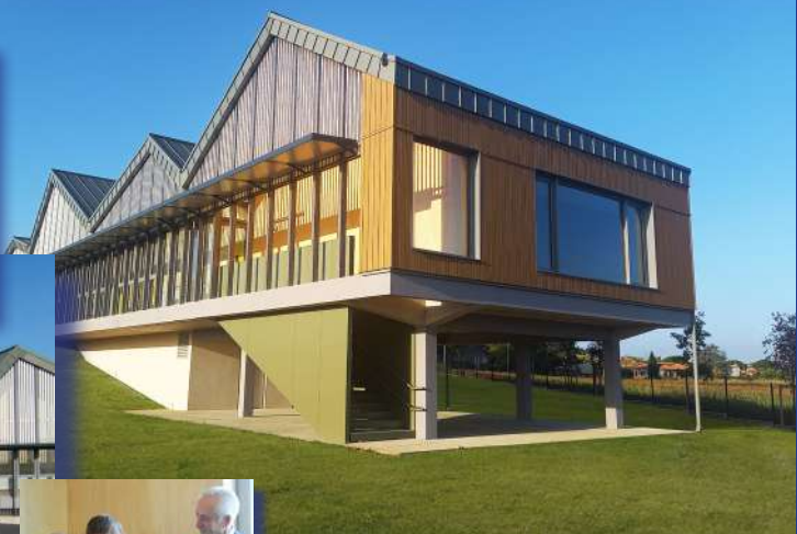
Centre de loisirs « Le pré en bulle »