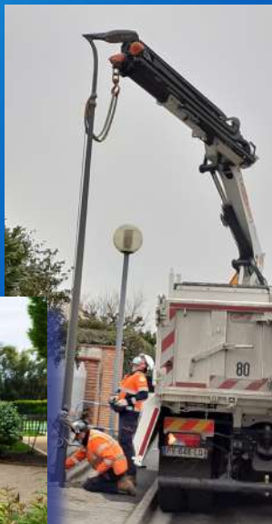
Remplacement lampes LED