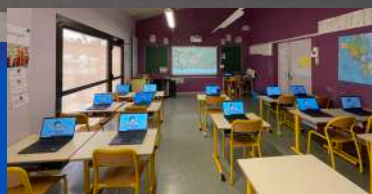
Ecole mobile de 12 ordinateurs + achat tablettes